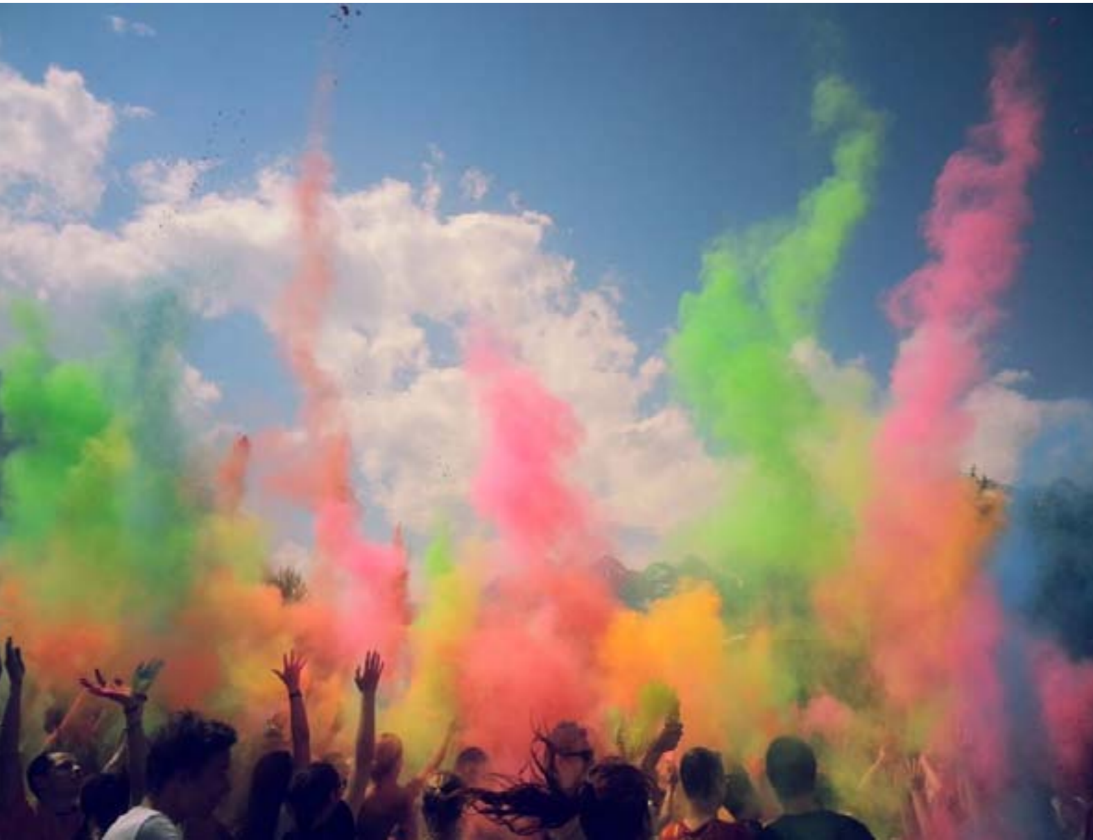
Matura 2013: „Holi“ - Die Maturandinnen und Maturanden feiern ein Farbenfest.